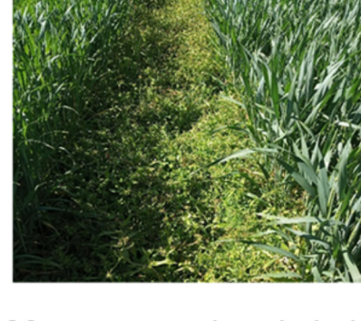
20 päeva peale pritsimist