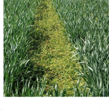
12 päeva peale pritsimist