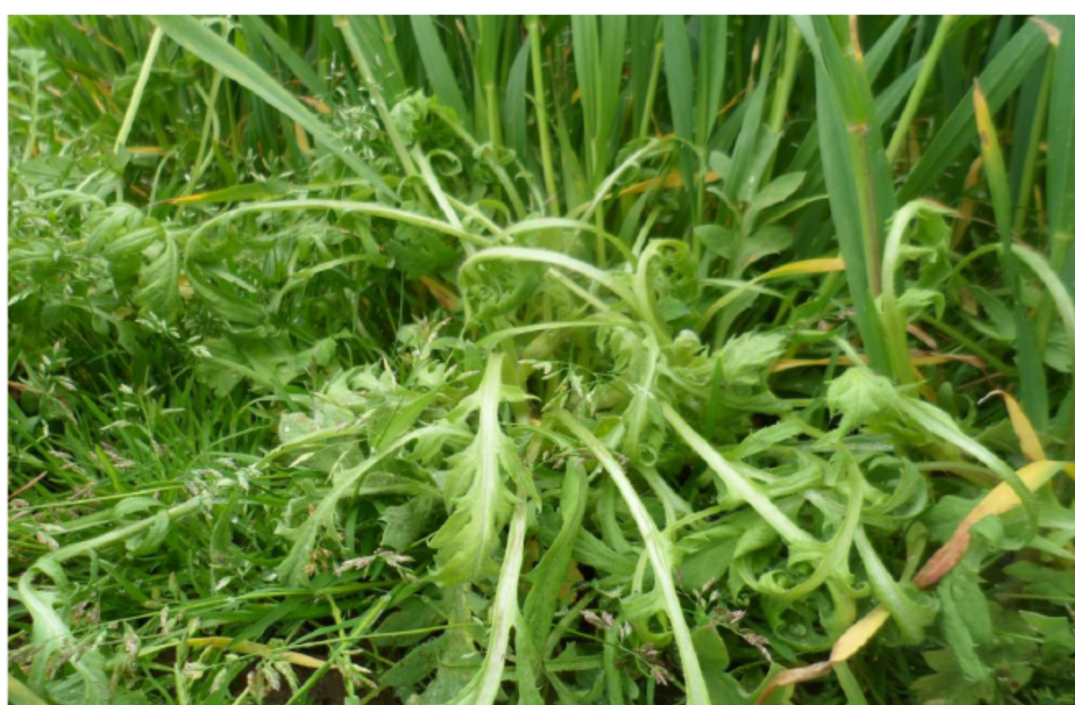
Pixxaro™ EC efektiivsus maguna tõrjel