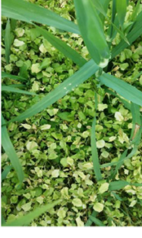
7 päeva pärast pritsimist